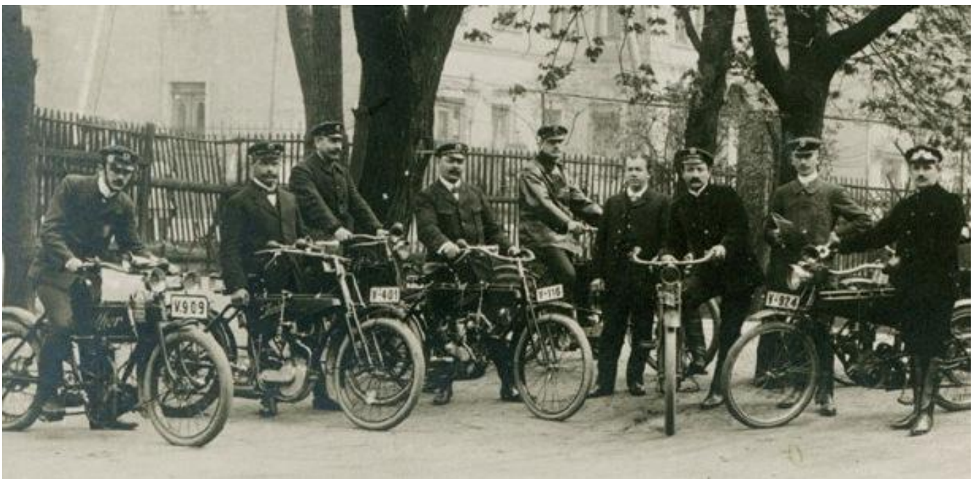
Aus: Libor Marcik

auf dem Vereinsgelände des MSC Dom-Esch e.V., in 53881 Dom-Esch